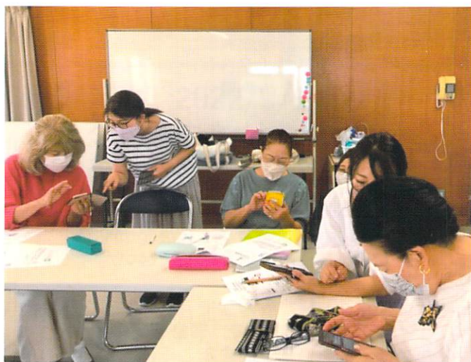
スマホ教室の様子

これにより働き盛りの世代が持つ柔軟なアイデア、女性の力、そしてベテランのバックアップという、とても良いバランスで運営することができているのです。