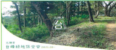
北鎌倉台峰緑地保全会

受け入れ団体から感想や新たな気づきを寄せていただきました。その中から2つご紹介します。