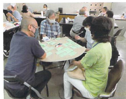
たくさんのご意見が出てきました

このお話しを通じて、他の団体の活動を知って、団体同士のつながりの可能性が広がったようです。また、東北の支援活動の経験のある方から「一緒に食べようと地道に避難民に声をかけ、住民同士のつながりが広がった」という素敵な経験談も聞かれました。