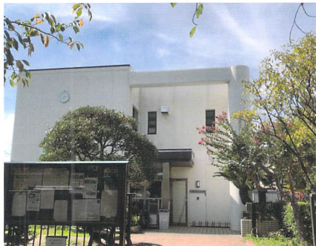
七里ガ浜自治会館

まだ構想段階ですが、今年度から検討がはじまった「七里ガ浜スマートタウン化」構想があります。