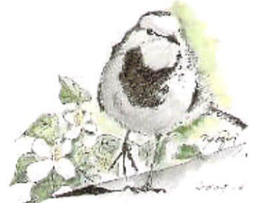
ハクセキレイとジュウヤク / 西畑直樹